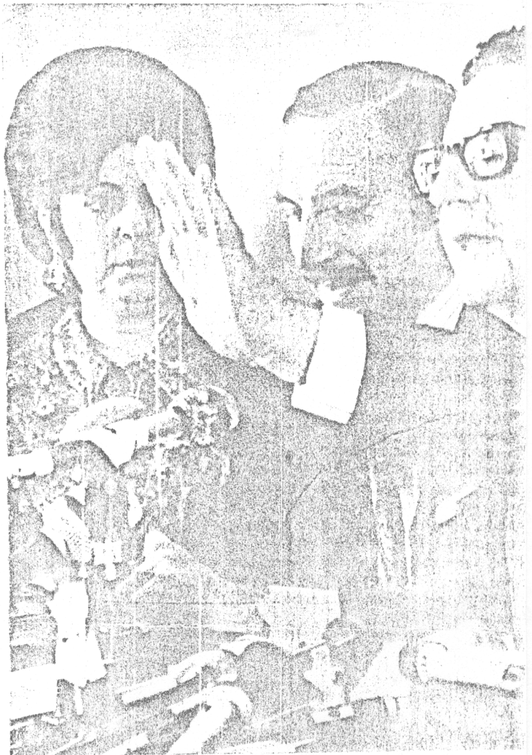
SALVADOR ALLENDE El "Padrino" mata desde la tumba